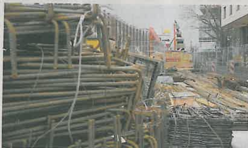
Stahlbügel der Art, die beim U-Bahn-Bau gestohlen wurden, lagern an der Baustelle am Kölner Heumarkt.

Auch in Düsseldorf hat die Nachricht vom Putsch am Kölner U-Bahn-Bau erhebliche Unruhe ausgelöst – vor allem, weil ein unter Verdacht geratener Polier auch in Düsseldorf gearbeitet hat, inzwischen aber beurlaubt wurde. In Absprache mit dem Rathaus und auf