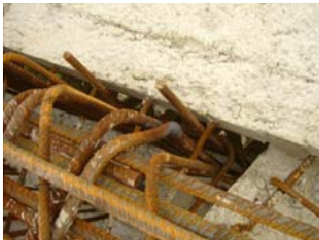
Rückbiegen der Bewehrung

Die Lage der Bewehrung ist verkehrt, die tragende untere Bewehrungslage wurde an der Oberseite des Treppenlaufes eingebaut. Das Bauteil ist nicht tragfähig.