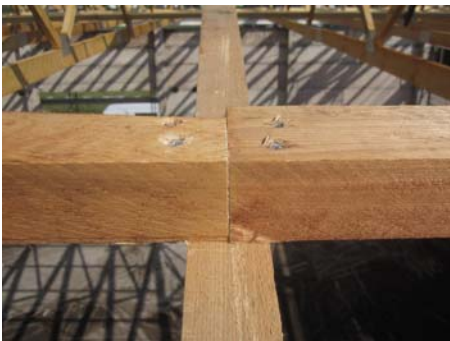
Lattenstoß auf Obergurt

Wegen Maßproblemen wurden die Löcher der Passdübel aufgebohrt. Damit ist die Tragwirkung dieses Anschlusses nicht mehr gegeben.