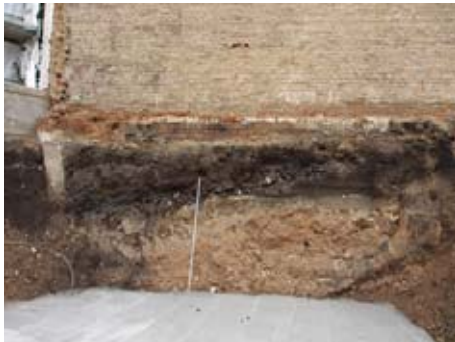
Sicherung der Nachbarbebauung