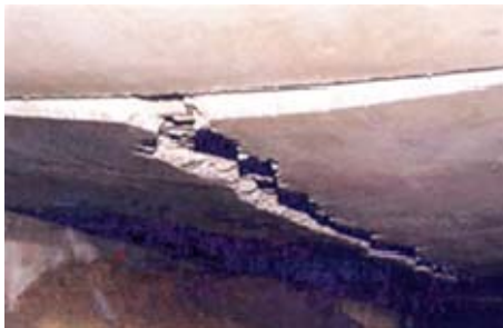
Abstützungen im Bauzustand

Bei diesem Bauvorhaben wurden die erforderlichen Hilfsunterstützungen im Abstand von ca. 1,50 m nicht eingebaut.