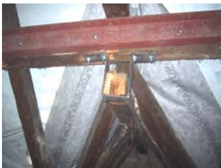
Dachverstärkung im Altbau

Wegen Maßproblemen wurde die Stahlstütze nicht unter den lastbringenden Stahlträger gestellt. Der Lastabtrag sollte über die Schweißnaht erfolgen.