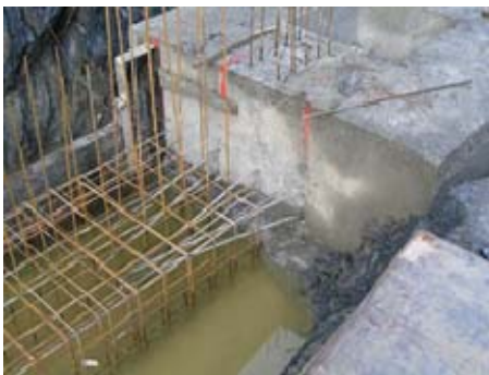
Köcher- bzw. Arbeitsfugenausbildung

Die Verwendung von Folie auf der Schalung verursachte eine unzureichende Oberflächenqualität der Decke.